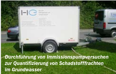
Durchführung von Immissionspumpversuchen zur Quantifizierung von Schadstofffrachten im Grundwasser

Mit der Vorbereitung auf EcoStep haben wir unter anderem eine Erweiterung im Hinblick auf den Umwelt- und Arbeitsschutz erreicht und unsere internen Abläufe im Zug ihrer Überprüfung weiter verbessert. Die Zertifizierung als externe und neutrale Begutachtung unseres Managementsystems hat darüber hinaus die Außendarstellung unseres Unternehmens noch einmal verstärkt und somit das Vertrauen von bestehenden und neuen Kundenbeziehungen in das Unternehmen wesentlich gefestigt.