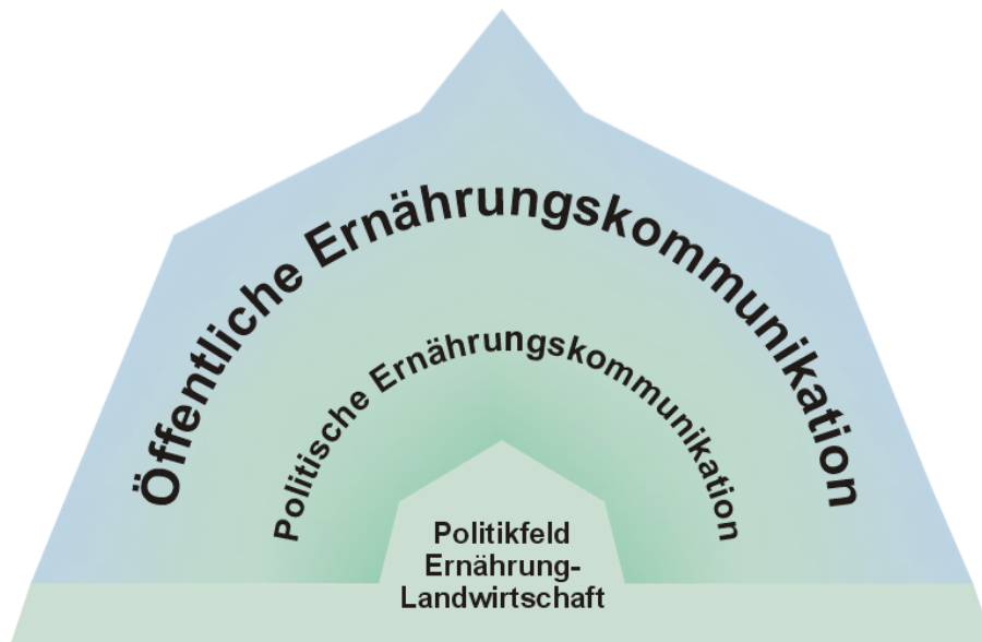
Abbildung 2: Ernährungskommunikation zwischen Politik und Öffentlichkeit

Ein Modell des Zusammenhangs der drei Kompartimente ist in Abbildung 2 dargestellt. Politische Kommunikation hat eine Vermittlerrolle zwischen dem Politikfeld, als Ergebnis vorangegangener politischer Kommunikation, und der Öffentlichkeit. Sie ist sowohl Medium der Konzeption und Veränderung des Politikfelds, als auch Übermittlerin von Impulsen aus dem Politikfeld in die Öffentlichkeit.