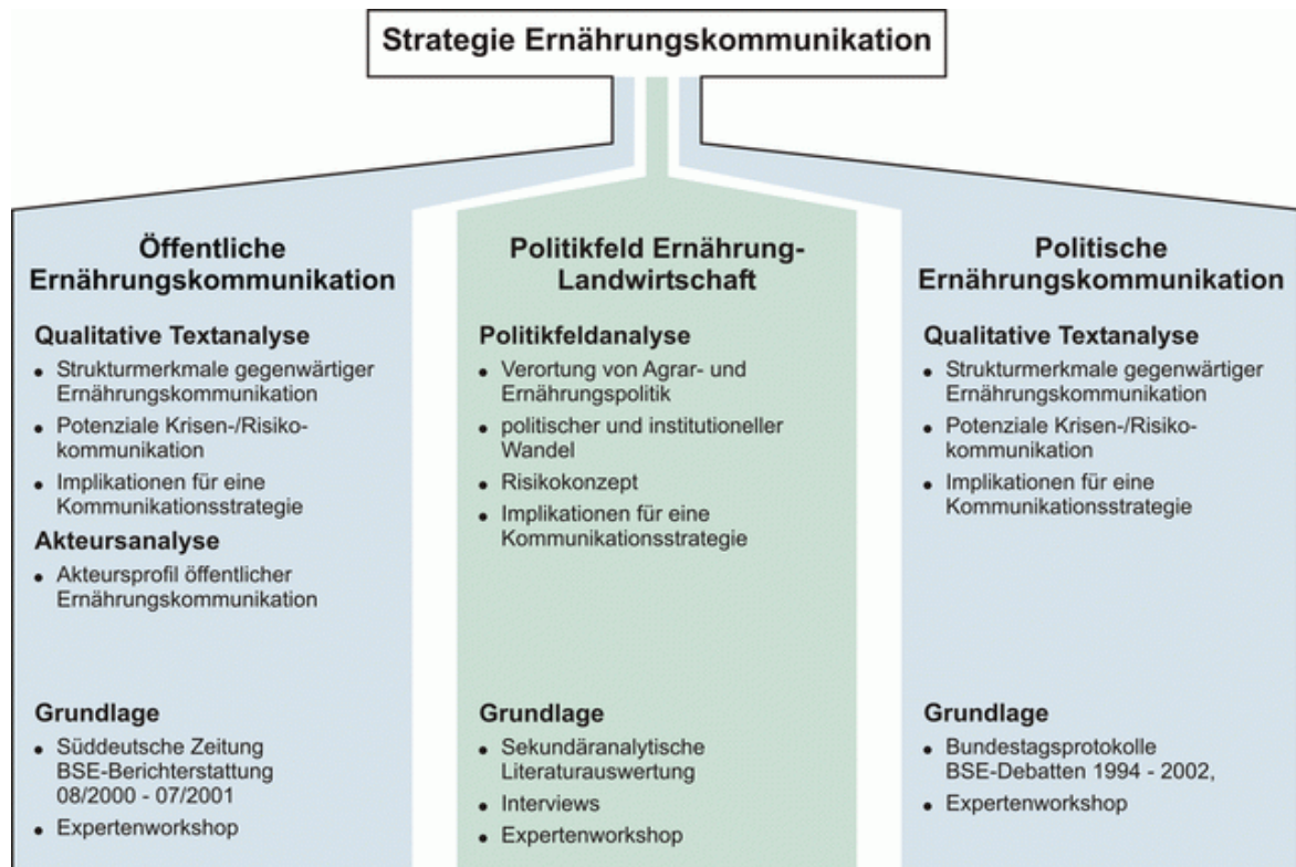
Abbildung 1: Forschungslinien des Moduls Ernährung und Öffentlichkeit

Die Untersuchung der öffentlichen Ernährungskommunikation 1 ist eine von drei Forschungslinien des Moduls Ernährung und Öffentlichkeit . Einen Überblick über die Untersuchungsgegenstände des Gesamtmoduls und ihren Beitrag zur Entwicklung einer Strategie für die Ernährungskommunikation vermittelt Abbildung 1.