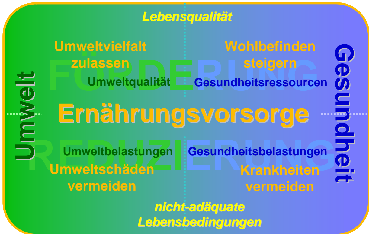
Abbildung 2 Sozial-ökologische Vorsorge: Schutz- und Förderkonzept

Sozial-ökologische Vorsorge erfordert, diese vier Aspekte, die den Kern eines sozial-ökologischen Vorsorgekonzepts darstellen, integriert zu betrachten. Im Hinblick auf sozialökologische Ernährungsvorsorge geht es darum, zu identifizieren, wie die gesellschaftlichen Ernährungsverhältnisse so gestaltet werden können, dass sie dazu beitragen, diese Zielsetzungen zu erreichen. Unter einer KonsumentInnenperspektive rücken dann die Praktiken der Bedürfnisbefriedigung, das Ernährungshandeln der KonsumentInnen ins Zentrum. 60 Sozial-ökologische Ernährungsvorsorge orientiert sich dementsprechend an den unterschiedlichen Versorgungsmustern und -situationen der KonsumentInnen sowie den soziokulturellen und strukturellen Aspekten, die diese bestimmen.